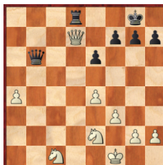
θέση ανάλυσης μετά από 29...Πδ8

Πολλά σημεία αυτής της παρτίδας αξίζουν διάγραμμα καθώς ήταν γεμάτη με όμορφα τακτικά μοτίβα. Ο μαύρος μπήκε σε αυτή τη συνέχεια έχοντας δει εδώ την κίνηση που έπαιξε 29...Bb6+ και είχε μετρήσει ότι στο 30. Ρζ1 Πδ8! θα κέρδιζε βασίλισσα γιατί αν έφευγε έκανε ματ στο δ1. Ο λευκός δυστυχώς για αυτόν «τον πίστεψε» και στο 29...Bb6+ αποφάσισε να δώσει κομμάτι με 30. Ιδ4. Τι δεν είδαν και οι δύο;