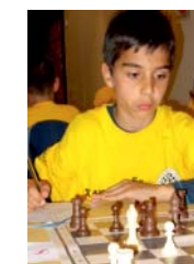
Βαθμολογία μετά τον 6ο γύρο B' group : 1.Στειακάκης 5,5 β. 2-5) Ηλιάκης, Τσαπάκης, Αγγελιάκης, Γιαλιτάκης 5 β.