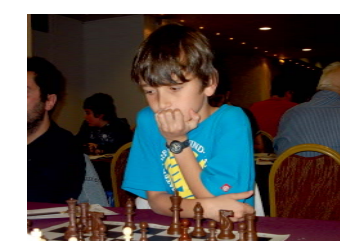
Βαθμολογία μετά τον 6ο γύρο A' group : 1. Λυριντζάκης 5,5 β. 2-3) Ξυλογιαννόπουλος, Σερπετσιδάκης 5 β.